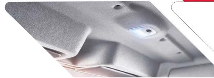
ಕ್ಯಾಬಿನ್ LED ಲ್ಯಾಂಪ್