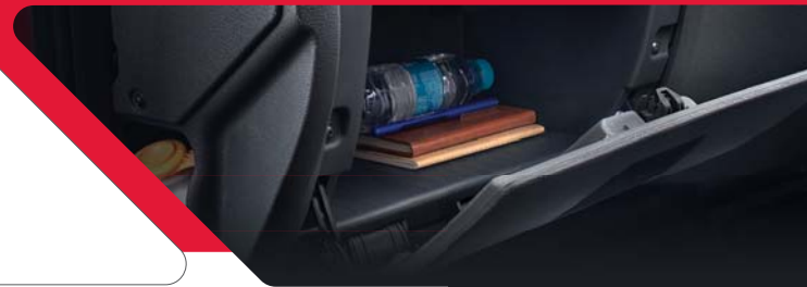
ಅನೇಕ ಸ್ಟೋರೇಜ್ ಸ್ಥಳಗಳು