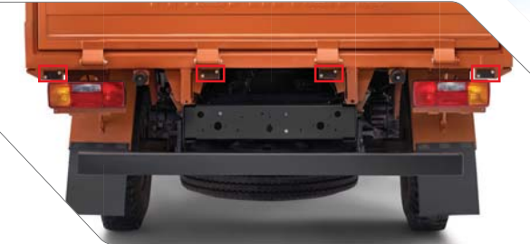
ರಿವರ್ಸ್ ಪಾರ್ಕಿಂಗ್ ಅಸಿಸ್ಟ್ ಸಿಸ್ಟಮ್ (RPAS)