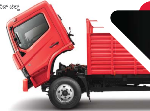
ಸುಲಭ ಕ್ಯಾಬಿನ್ ಟಿಲ್ಡ್