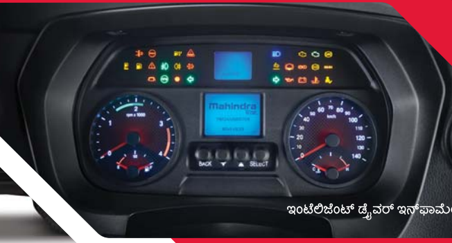
ಇಂಟೆಲಿಜೆಂಟ್ ಡ್ರೈವರ್ ಇನ್‌ಫಾರ್ಮೇಶನ್ ಸಿಸ್ಟಮ್