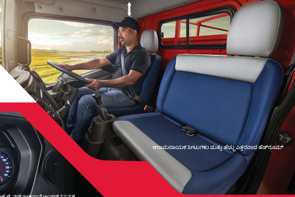
ಆರಾಮದಾಯಕ ಸೀಟುಗಳು ಮತ್ತು ಹೆಚ್ಚು ಎತ್ತರವಾದ ಹೆಡ್‌ರೂಮ್