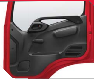
ಡೋರ್‌ನಲ್ಲಿ ಯುಟಿಲಿಟಿ ಪಾಕೆಟ್ ಮತ್ತು ಸ್ಟೀಕರ್ ಸೌಲಭ್ಯ