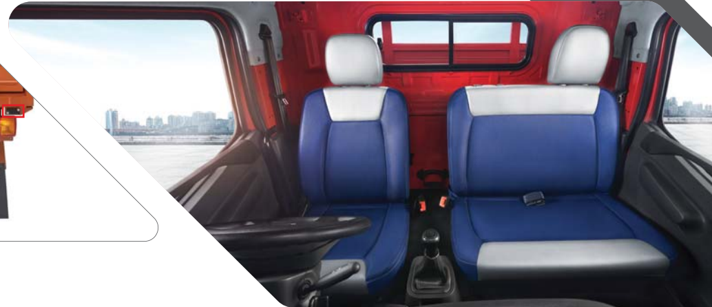
ವಿಶಾಲ ವಾಕ್‌ಥೂ, ಕ್ಯಾಬಿನ್