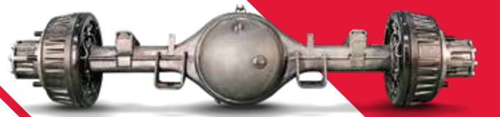
ഹെവി ഡ്യൂട്ടി റിയർ ആക്സിൽ