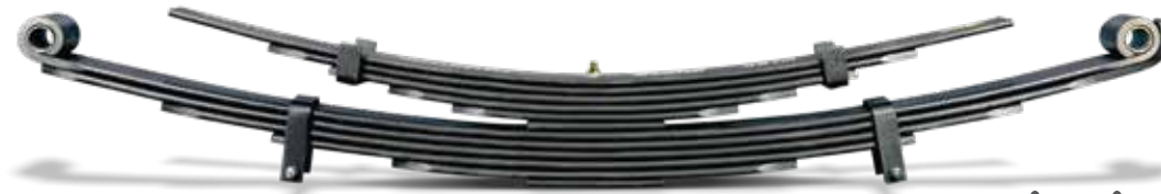
ഹെവി ഡ്യൂട്ടി സസ്പെൻഷൻ

ഇന്ത്യൻ റോഡുകൾക്കായി നിർമ്മിച്ച ഉയർന്ന കരുത്തുള്ള ചേസിസ്