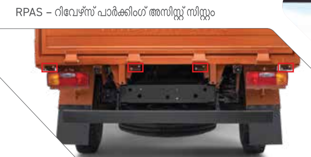
RPAS - റിവേഴ്സ് പാർക്കിംഗ് അസിസ്റ്റ് സിസ്റ്റം