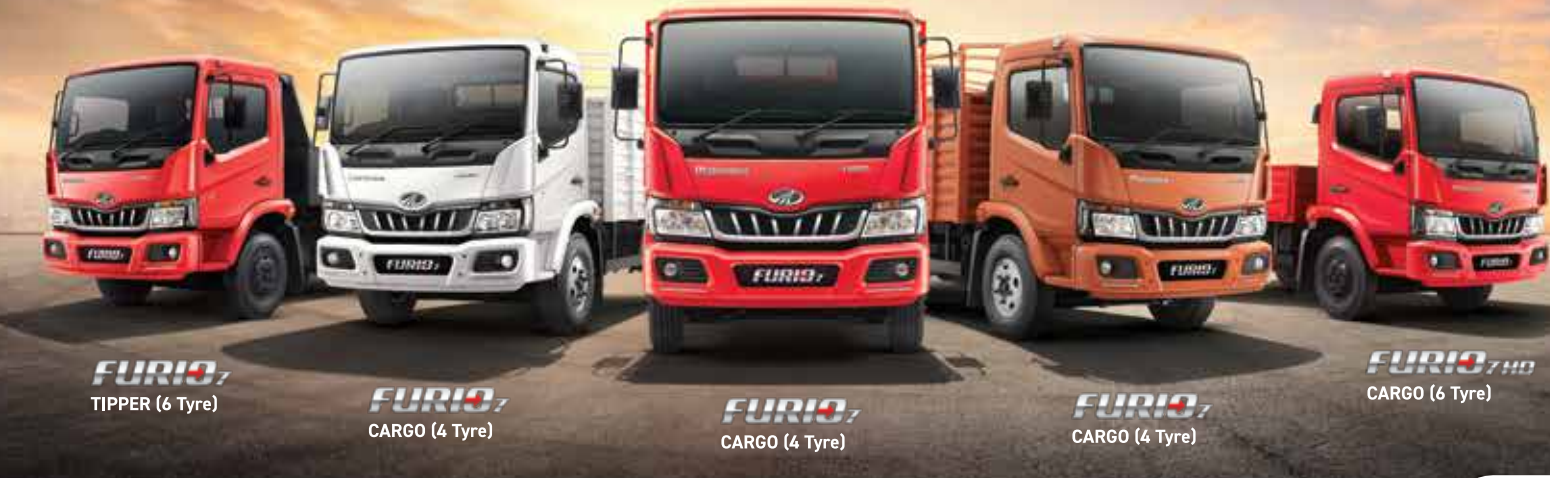
FURIO 7 TIPPER (6 Tyre) FURIO 7 CARGO (4 Tyre) FURIO 7 CARGO (4 Tyre) FURIO 7 CARGO (4 Tyre) FURIO 7 HD CARGO (6 Tyre)

ഇന്ത്യയിലെ LCV വിഭാഗത്തിൽ വിപുലം സൃഷ്ടിക്കുകയും നിങ്ങളുടെ ബിസിനസിൽ വളരെ വലിയ മാറ്റങ്ങൾ വരുത്തുകയും ചെയ്യുന്ന പുതിയ LCV കളുടെ ശ്രേണി അവതരിപ്പിക്കുന്നു. മഹിന്ദ്ര FURIO - ഭാരം കുറഞ്ഞ വാണിജ്യ വാഹനങ്ങളുടെ ശ്രേണി. FURIO ലൈനിൽ നിന്നുള്ള LCV കളുടെ ഒരു ശ്രേണി, ഈ ക്രമം നിങ്ങളുടെ ലാഭം ഉയർത്തുന്നതിന് മികച്ച മൈലേജും ഉയർന്ന പേലോഡ് ശേഷിയും വാഗ്ദാനം ചെയ്യുന്നു. സമാന്തരകളില്ലാത്ത ഗുണങ്ങളും മികച്ച ഡ്രൈവിംഗ് സൗകര്യവും സുഖവും കൂടുതൽ സുരക്ഷയും ഉറപ്പു നൽകുന്ന ഏറ്റവും മികച്ച കാബിനോടൊത്ത് ഇതു വരുന്നു. ഞങ്ങളുടെ LCV കളുടെ പുതിയ ശ്രേണിയുടെ ഗ്യാരന്റിയായാണ് ഇതിന്റെ ഏറ്റവും മികച്ച വശം. FURIO 7 കാർഗോ ക്രമം നിങ്ങൾക്ക് ഒരു സവിശേഷമായ ഇരട്ട ഗ്യാരണ്ടി നൽകുന്നു ('ഏറ്റവും കൂടുതൽ മൈലേജ് നേടുക അല്ലെങ്കിൽ ക്രക്ക് തിരികെ നൽകുക', '5 വർഷത്തിനുശേഷവും ഉറപ്പായ റിസെയർ മുഖ്യം നേടുക'), FURIO 7 ടിപ്പർ ലാഭം ഉറപ്പു നൽകിക്കൊണ്ടാണ് എത്തുന്നത് ('കൂടുതൽ ലാഭം നേടുക അല്ലെങ്കിൽ ക്രക്ക് തിരികെ നൽകുക'). ഏത് LCV ബ്രാൻഡാണ് നിങ്ങൾക്ക് ഇത്തരം ഉറപ്പുകൾ നൽകുന്നത്?