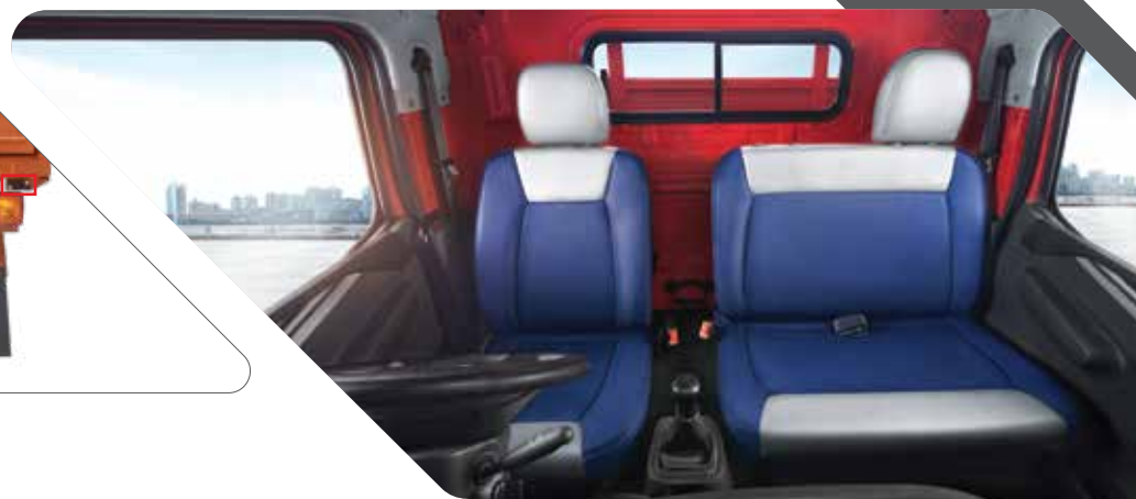
വിശാലമായ വാക്ട്രൂ കാബിൻ