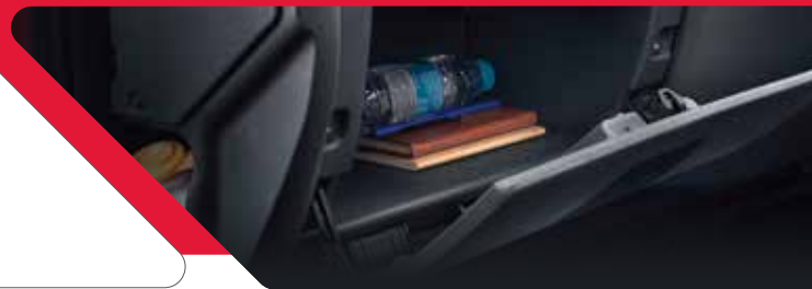
നിരവധി സ്റ്റോറേജ് സ്പേസ്