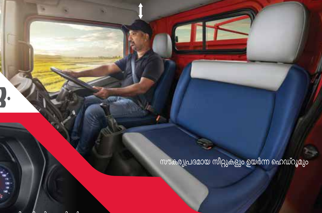
സൗകര്യപരമായ സീറ്റുകളും ഉയർന്ന ഹെഡ്റൂമും