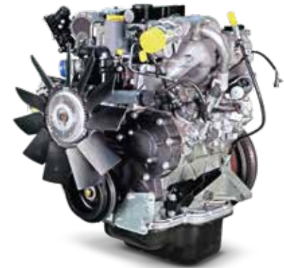
DOC (ഡിസൽ ഓക്സിഡേഷൻ കാറ്റലിസ്റ്റ്) / DPF (ഡിസൽ പാർട്ടികുലേറ്റ് ഫിൽട്ടർ)

ഒരു വിശ്വസനീയമായ 2.5 ലിറ്റർ mDi എൻജിനോടൊപ്പം വരുന്ന 4-ടയർ FURIO 7-ന് ഒരു 1600 ബാർ ബോഷ് കോമൺ റെയിൽ സംവിധാനവും ഒരു ഇലക്ട്രോണിക് വേസ്റ്റ്ഗേറ്റ് ടർബോചാർജറും ഉണ്ട്, ഇത് പവറിൽ ഒരു വിട്ടുവീഴ്ചയും കൂടാതെ ഏറ്റവും മികച്ച മൈലേജ് നിങ്ങൾക്ക് നൽകുന്നു. കൂടാതെ, ഒരു സ്ട്രെച്ച് ഫീറ്റ് ബെൽറ്റ് ഇതിനുണ്ട്, അതുകൊണ്ട് ബെൽറ്റ് ടെൻഷൻ മാന്യവലായി അഡ്ജസ്റ്റ്മെന്റ് ചെയ്യേണ്ട ആവശ്യം വരുന്നില്ല.