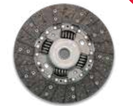
280 mm & 310 mm വ്യാസമുള്ള LUK ക്ലച്ച്