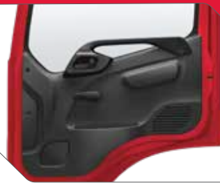
യൂട്ടിലിറ്റി പോക്കറ്റും സ്പീക്കർ പ്രൊവിഷനും ഉള്ള വാതിൽ