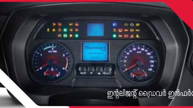
ഇൻലിജന്റ് ഡ്രൈവർ ഇൻഫർമേഷൻ സിസ്റ്റം