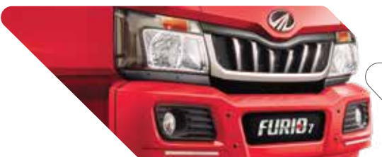
വിശാലമായ ഫോഗ് ലാമ്പുകൾ