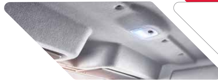
ക്യാബിൻ LED ലാമ്പ്